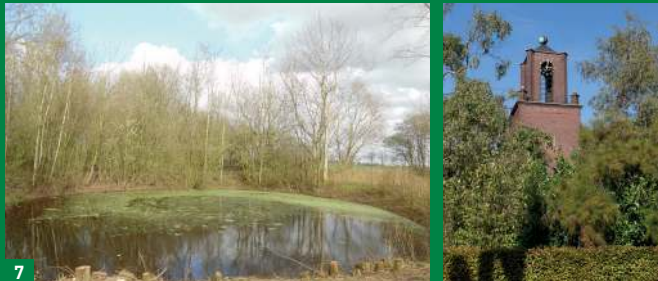
Poel bij industrieterrein Haansberg.

Staan in de buurt van Stad Parijs hebt u waarschijnlijk niet het gevoel dat uw vertrekpunt in Hulten ligt. Toch is het zo. Wat in een ver Germaans verleden 'Holten', 'Hoelten' of 'Hoilen' genoemd werd, is vanaf de 18e eeuw definitief Hulten. 'Hult' zou best wel 'holt', 'holz', 'hout' kunnen betekenen, of beter nog: 'bos' of 'bosjes'. Hulten ligt nog steeds tussen bos (de zuidkant) en broek (de noordkant).