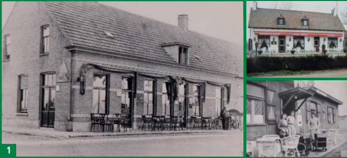
1 Restaurant Stad Parijs in 1940 (links), in 2013 (boven) en noodlokaal in 1944 (onder).