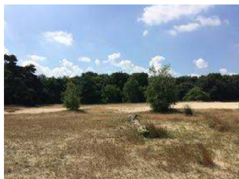
"tussen 2 vrijstaande berken"