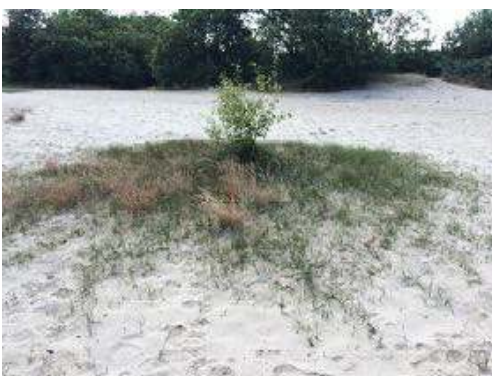
"eerst naar het kleine boompje"

Je ziet voor je een boomgroep. Loop daarnaar toe en loop linksom de bomengroep. Richt je nu op de uitstekende lichtmast, die ver weg, in het zuiden, boven de bomen uitsteekt en loop die richting op. Steek de vlakte rechtover, tussen twee kleine vrijstaande berken door.